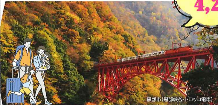
黒部市(黒部峡谷トロッコ電車)