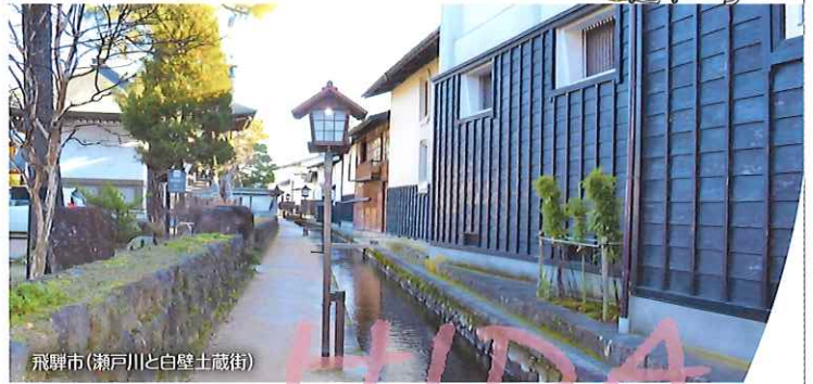
飛騨市(瀬戸川と白壁土蔵街)