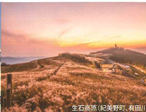
生石高原(紀美野町、有田川)