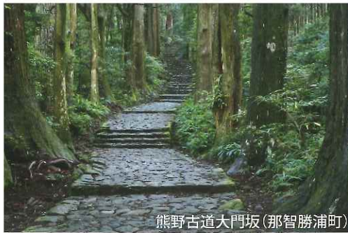
熊野古道大門坂(那智勝浦町)